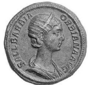
Sallustia Barbia Orbiana, sesterce de bronze