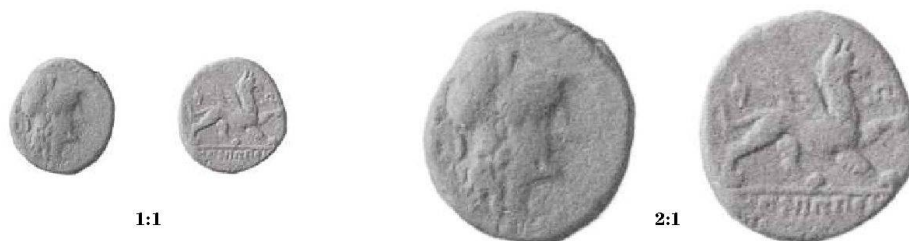
Fig. 4: Exemple de Winterthur: 3,87 g; 15,8 mm; direction des coins à 12 h.

position, on trouve les monnaies émises en Gaule du sud (18%), en particulier celles de Nîmes et des Volques arécomiques 8 , et secondairement les monnaies émises à Cavaillon même. Les autres monnayages, vallée du Rhône, Gaule interne, République romaine ne sont représentés qu'en nombre réduit d'exemplaires. 9