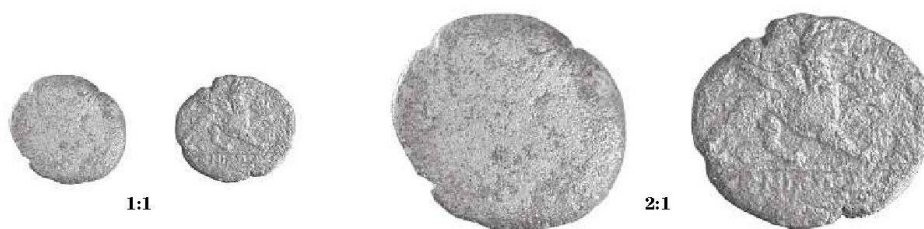
Fig. 2: Bronze de Phocée (fin III e s.–début II e av. J.-C.), trouvé à Cavaillon.

Notre exemplaire a un droit très usé, pratiquement lisse; on distingue vaguement le rebord du casque d'Athéna; au revers, le griffon est bien visible, les deux lettres de l'ethnique se devinent à peine, et la légende de l'exergue est incomplète: [M]ENIPΠ[ΟΣ] (fig. 2).