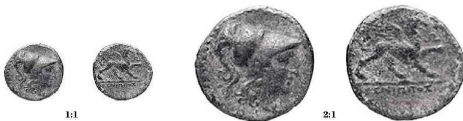
Fig. 3: Exemplaire de Paris: 2,95 g; direction des coins à 12 h.

Cette monnaie est très rare, puisqu'il n'en existe que deux exemplaires connus, avant la découverte du nôtre, l'un conservé au Cabinet des médailles de la Bibliothèque nationale à Paris (fig. 3) 6 , l'autre publié dans la collection numismatique de Winterthur (fig. 4) 7 .