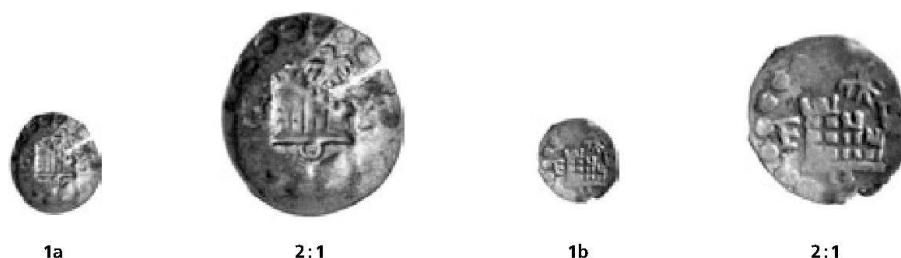
Abb. 1: Freiburg i.Üe., Stadt, Schüsselpfennig o. J. vom Typ Morard/Cahn/Villard 22.

Eine Schweizer Kleinmünze, deren Datierung in den Referenzwerken etwas Mühe bereitet, ist der Schüsselpfennig von Freiburg im Üechtland, den N. Morard, E. Cahn und Ch. Villard in ihrem grundlegenden Werk zur Freiburger Münzgeschichte als Maille bzw. Halbpfennig unter der Nummer 22 in die Prägeperiode 1476–1529 setzen 1 . In einer Anmerkung präzisieren sie, dass die Münze möglicherweise bis ins 16. Jahrhundert hinein geprägt wurde. Die Münze zeigt die Freiburger Burg über einem kleinen (Halb-) Ringel und zwischen den Buchstaben F – B, darüber rechts einen kleinen Adler mit nach links gewandtem Kopf. Das Bild ist von einem groben Perlkreis umgeben. Dieser Münztyp ist flach und schüsselförmig belegt.