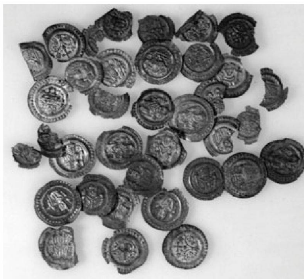
Abb. 1: 2004 wurde im Oberwilerwald bei Cham ZG ein Hort mit mindestens 46 Münzen des 13. Jahrhunderts entdeckt. Es handelt sich um Prägungen von Konstanz, Lindau, Ravensburg, Sigmaringen und St. Gallen, also um sogenannte Bodensee-Brakteaten. Diese waren bisher in der Zentralschweiz völlig unbekannt (vgl. IFS 9, 2009, S. 116–120).

Im zweiten Jahrzehnt konnten neben dem alljährlich erscheinenden Bulletin IFS ITMS