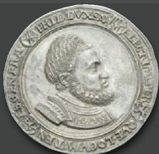
Kurfürstentum Sachsen Friedrich III. der Weise, 1486 – 1525. Breiter Gulden-groschen o. J. (nach 1507) mit Titel Maximilians I., auf die Generalstatthalterwürde. RR. Vorzüglich.