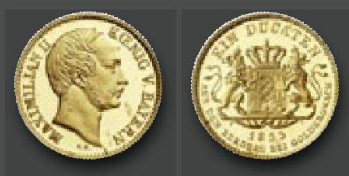
Königreich Bayern Maximilian II., 1848 – 1864. Dukaten 1855. Spätere Prägung zur Erinnerung an die Goldkronacher Ausbeute. Von allergrößter Seltenheit. Vorzüglich.