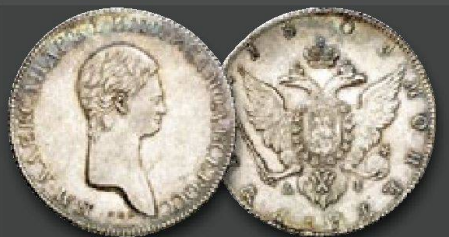
Kaiserreich Russland Alexander I., 1801 – 1825. Rubel 1801, St. Petersburg (Bankmünzstätte). Probe. Von größter Seltenheit. Vorzüglich +.