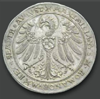
Kurfürstentum Sachsen Friedrich III. der Weise, 1486 – 1525. Breiter Guldengroschen o. J. (nach 1507) mit Titel Maximilians I., auf die Generalstatthalterwürde. RR. Vorzüglich.