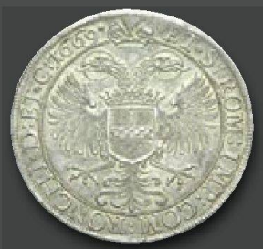
Italien, Ronco Napoleone Spinola, 1647 – 1672. Scudo 1669. Von größter Seltenheit. Vorzüglich.