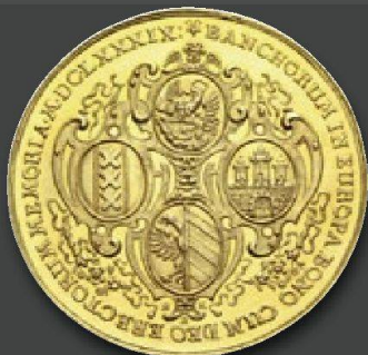
Stadt Hamburg Bankportugalozer zu 10 Dukaten 1689 von J. Reteke. RR. Fast Stempelglanz.