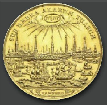
Stadt Hamburg Bankportugolöser zu 10 Dukaten 1689 von J. Reteke. RR. Fast Stempelglanz.