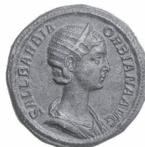
Sallustia Barbia Orbiana, sestertie de bronze

TRADART GENEVE SA 1, rue du Perron - 1204 Genève Tel +41 22 817 37 47 - Fax +41 22 817 37 48 e-mail : numismatique@tradart.ch site : www.tradart.ch