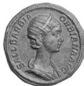
Sallustia Barbia Orbiana, sestertee de bronze

TRADART GENEVE SA 1, rue du Perron - 1204 Genève Tel +41 22 817 37 47 - Fax +41 22 817 37 48 e-mail : numismatique@tradart.ch site : www.tradart.ch