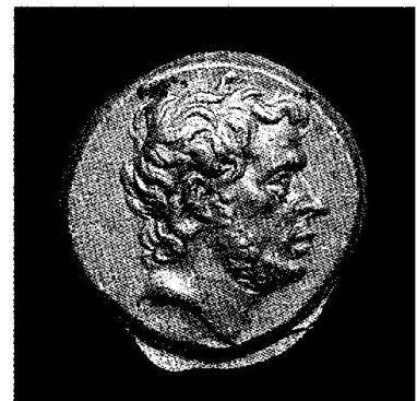
T. Quinctius Flaminius, statère d'or, Grèce, 196 avant JC