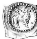
Abb. 3: Vierzipfelig Pfennig aus St. Gallen?, 2. Hälfte 13. Jh.? (Meyer [Anm. 3], Tf. 2, Nr. 82).

Der eine, dort mit sieben Exemplaren vertretene Typ 17 ist mit seinem Kreis aus groben Perlen ein typischer Breisgauer Pfennig. Wielandt bezeichnet ihn