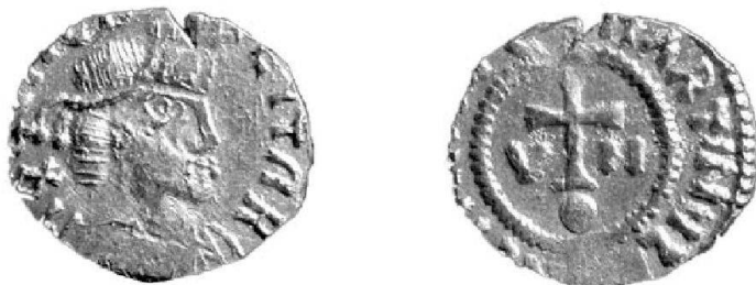
Abb. 2 (Mst. 3:1).