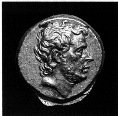
T. Quinctius Flamininus, statère d'or, Grèce, 196 avant JC

TRADART GENEVE SA 2, rue du Puits-St-Pierre - 1204 Genève Tél. +41 22 817 37 47 - Fax +41 22 817 37 48 e-mail : tradart.rp@tradart.ch