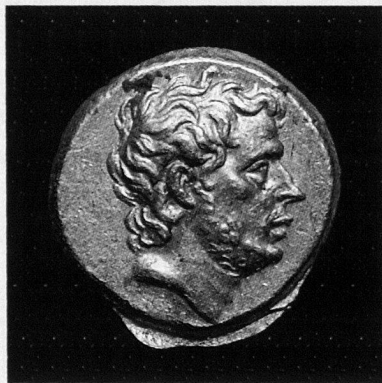
T. Quinctius Flaminus, statère d'or, Grèce, 196 avant JC