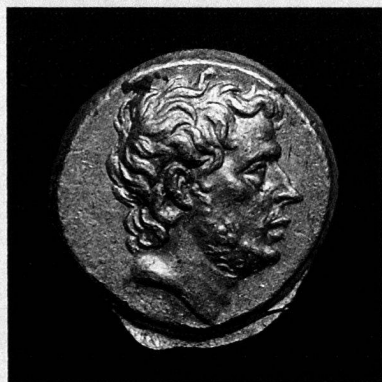
T. Quinctius Flamininus, statère d'or, Grèce, 196 avant JC