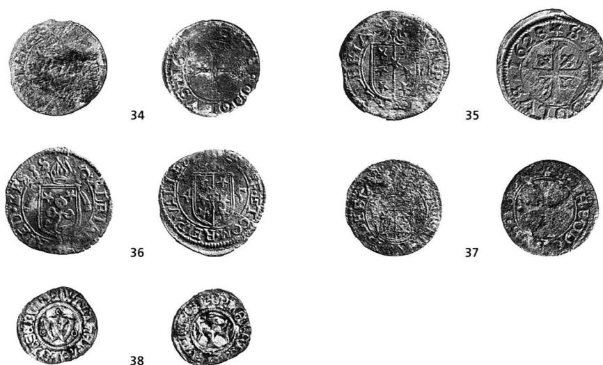
Figure 3: Les trouvailles à l'extérieur de l'église (n° 34–38).

Pendant les travaux, M. Alain Besse, restaurateur d'art occupé à la conservation des peintures murales de l'église, a utilisé les temps libres et une partie de ses loisirs à l'auscultation des déblais provenant des travaux extérieurs. Sa sagacité a été payante puisque cinq autres monnaies ont été trouvées (fig. 3). Nous le remercions d'avoir bien voulu déposer ces pièces dans notre institution afin de permettre de compléter notre étude. Comme elles proviennent toutes de secteurs remués, ces monnaies n'apportent aucun complément à l'histoire de l'église, mais peuvent par contre contribuer à améliorer nos connaissances des échanges monétaires et du type de pièces que l'on utilisait au quotidien dans un village rural valaisan 3 . Les trois premières pièces ont été trouvées agglomérées ensemble par la corrosion, avec des restes textiles sur l'une d'entre elles. On peut imaginer tout ou partie d'une bourse. La quatrième est une trouvaille isolée. La cinquième trouvaille de M. Besse se démarque des précédentes. Même si nous la publions en dernier, il s'agit probablement de la plus intéressante des 38 pièces présentées ici. Il s'agit d'une obole, ou denier, de Walther Supersaxo, premier évêque valaisan à avoir frappé monnaie. Les pièces de ce prélat sont rarement présentes dans les contextes de trouvailles archéologiques. On aimerait pourtant savoir dans quelle mesure les frappes indigènes de Walther Supersaxo ont supplanté les monnayages de billon utilisés auparavant en Valais 4 .