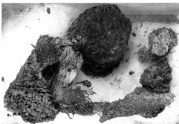
Figure 1: La bourse avant sa dissociation.

Les restes textiles concrétionnés sur les monnaies ont été analysés par Mme Antoinette Rast-Eicher, du Büro für archäologische Textilien, à Ennenda. Malgré le peu d'éléments conservés, il lui semble que la bourse était en lin (fig. 1). La dissociation du lot a permis de dégager 11 monnaies (fig. 2). Les deux pièces extrêmes n'ont toutefois pas pu être séparées de leur voisine immédiate à cause de leur grande fragilité. Les déterminations sont les suivantes (elles sont données dans l'ordre précis de la bourse):