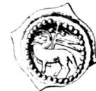
Abb. 1: St. Gallen, Stadt? / Abtei? Vierzipfliger Lamm-pfennig (ab etwa 1340), Typ A (Meyer, Taf. 2,78)

Es stellt sich daher die Frage, ob dieser Pfennigtyp allenfalls über längere Zeit hinweg mit demselben Münzbild hergestellt wurde und zumindest ein Teil der vierzipfligen Pfennige mit dem Lamm in die zweite Hälfte des 14. Jahrhunderts