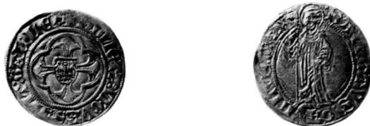
Abb. 6: St. Gallen, Stadt. Plappart 1424, Vs./Rs. Münzkabinett Winterthur, Inv. S. 495.

Dazu gehört eine Parallelprägung aus Zürich, die keine Jahrzahl trägt, aber denselben Wappenschild im Vierpass zeigt 60 . Von beiden Plapparten sind mehrere Stempel bekannt, die sich im Falle von Zürich in kleinen Details unterscheiden, im Falle von St. Gallen in zwei klar unterscheidbare Gruppen aufteilen lassen (Rs. kleiner und grosser Bär). Bei Schaffhausen lässt sich der Plappart von 1424 bisher nicht nachweisen, obschon belegt ist, dass 1424/25 Plappartstempel angefertigt wurden 61 .