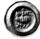
Abb. 4: St. Gallen, Stadt. Angster (ab 1407). Münzkabinett Winterthur, Inv. S 4362.

Hinweise aus Schriftquellen deuten nämlich darauf hin, dass die Münzstätte nicht nur 1407/08 aktiv war. Zwar scheinen konkrete Belege in den Seckelamtsrechnungen nach 1408 für einige Zeit abzubrechen 39 , aber Münzmeister Konrad Nämhart ist noch 1414 und 1416 in St. Gallen nachweisbar 40 . Ein gewichtiges Argument für eine Prägetätigkeit um 1415 ist auch die Erlaubnis von König Sigismund (1410–1437), die er am 12. April 1415 in Konstanz für die Stadt St. Gallen ausstellte: Darin gestattete er der Stadt, «das sy cleine müntze, haller und pfennig, under irer stat prech [= Prägezeichen, Münzbild] mit glichem tzusatz, als dann andere unsere und des richs stete, die müntz haben, zusetzen slahen und muentzen mögen» 41 . Die Stadt nutzte offensichtlich die Anwesenheit des Königs am Konstanzer Konzil dazu, mit dieser etwas ungewöhnlichen Erlaubnis – es ist ja kein Münzrecht, sondern lediglich eine Genehmigung zur Herstellung von Kleingeld – die längst angelaufene Prägetätigkeit durch das Reichsoberhaupt nachträglich sanktionieren zu lassen. Es ist gut möglich, dass man 1415 nochmals die Gelegenheit wahrnahm, die Prägung nach einer Pause wieder aufzunehmen, obschon dafür bisher keine Belege nachzuweisen sind.