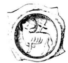
Abb. 3: St. Gallen, Stadt? / Abtei? Vierzipfliger Lamm-pfennig (ab etwa 1340), Typ C (Meyer, Taf. 2,83)