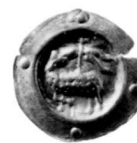
Abb. 5: St. Gallen, Stadt. Angster (1424/25). Jona-Busskirch SG, Kirche St. Martin 1975 54 .

Die bekannteste Prägung nach dem Vertrag von 1424 ist ohne Zweifel der St. Galler Plappart mit der Jahrzahl «1424» in gotischen Zahlzeichen auf der Rückseite (Abb. 6). Es handelt sich um die älteste Schweizer Münze mit einer Jahrzahl.