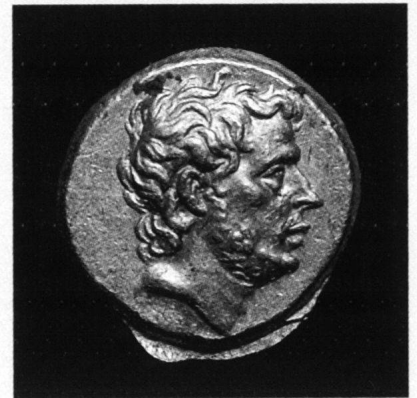
T. Quinctius Flamininus, statère d'or, Grèce, 196 avant JC

TRADART GENEVE SA 2, rue du Puits-St-Pierre - 1204 Genève Tél. +41 22 817 37 47 - Fax +41 22 817 37 48 e-mail : tradart.rp@tradart.ch