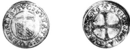
Zürich, Halbbatzen 1555/1556