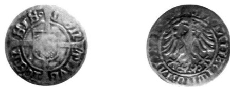
Zürich, Schilling 1519

Beim hier abgebildeten Schilling von 1519 sieht man sogleich, dass bei der Prägung dieser Münze zwei Stempel verwendet wurden, die von verschiedenen Stempelschneidern hergestellt wurden. Die Vorderseite weist dieselben auffällig grossen Buchstabenpunzen auf wie beim undatierten Schilling, während die Rückseite eine feinere Umschrift zeigt, wie wir es uns von den Stücken mit den Jahreszahlen 1518 und 1519 gewöhnt sind. Die Verwendung älterer Stempel aus Spargründen wird wohl auch in diesem Fall der Grund gewesen sein.