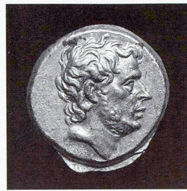
T. Quintius Flaminus, statère d'or, Grèce, 196 avant JC