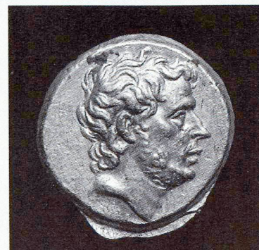
T. Quintius Flaminus, statère d'or, Grèce, 196 avant JC