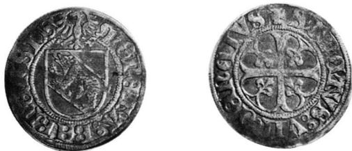
Bern, Batzen o. J.

Mehrere Varianten dieser frühesten Batzen sind bekannt, und die auffälligen S finden sich immer auf der Rückseite, am Ende der Umschrift. Die an dieser Stelle vorgestellte Variante zeigt das S mit Sporen auf der Vorderseite, ebenfalls als letzten Buchstaben.