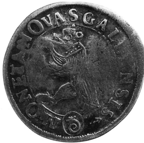
Vorderseite von B (vergrössert)

der ursprüngliche Stempelschneider – kurzerhand einen neuen Bären in den Stempel geschnitten hat.