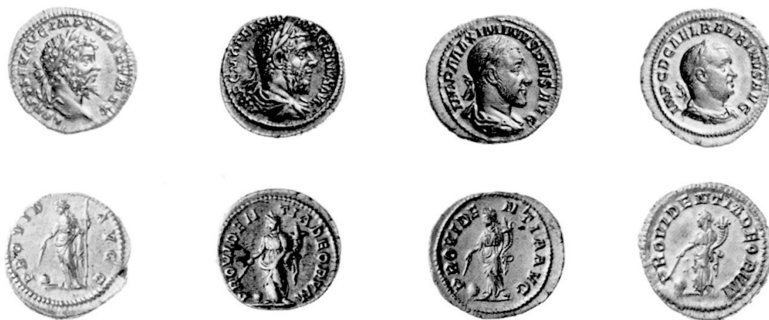
fig. 5 11

baguette. C'est la vindicta avec laquelle la Providence garantit la liberté du monde représenté à ses pieds par un globe. Cette représentation fait pendant à celle de la Liberté qui tient un pileus dans les émissions parallèles (fig. 5).