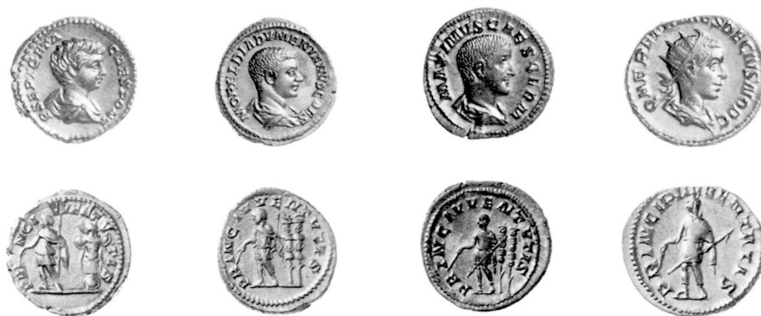
fig. 6 12

Un autre exemple de la représentation d'une vindicta se rencontre sur des pièces où est figuré au revers le princeps juventutis . Le fils de l'empereur tient dans sa main droite la même baguette que la Providence (fig. 6). En présentant son fils comme garant de la liberté publique, l'empereur prépare ainsi l'opinion à sa succession.