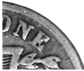
Abb. 3: Vergrösserter Ausschnitt 3:1 des auffälligen, im rechten Feld beinahe ausgefüllten N.