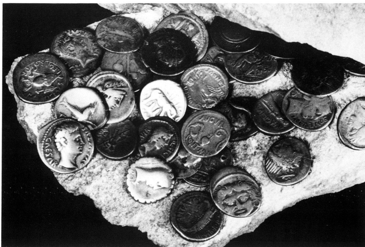
Le trésor de Dombresson NE, découvert en 1824.

du mardi au dimanche 10 à 12 h et 14 à 17 h, jeudi entrée gratuite.