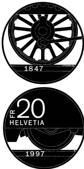
Entwürfe von Vs. u. Rs. der Gedenkmünze 1997

sujet entsprechend wird diesmal der Hauptanteil für die Restauration von historischem Rollmaterial verwendet.