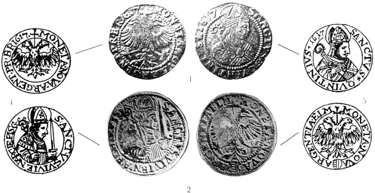
Abb. 8 Zusammenstellung der vier Kombinationen von Vorder- und Rückseiten von Nr. 1, 2, 4 und 5.