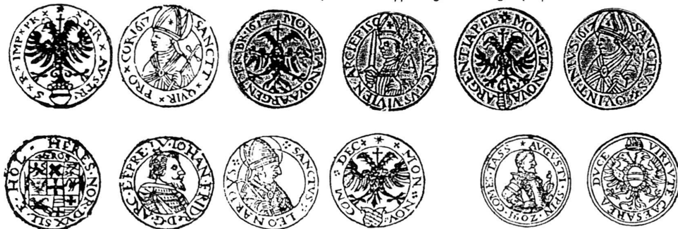
Abb. 7 Illustrierte Münzordnung (40x73 cm) des Oberrheinischen Kreises (Darmstadt 1620) aus Klüssendorf (Anm. 8), Ausschnitt.

Diese Stüd Diefpfening vnd alle dergleichen sind verboten.