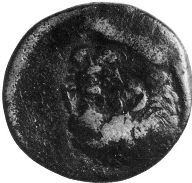
Fig. 2 Contremarque du bronze de Paris (× 3)