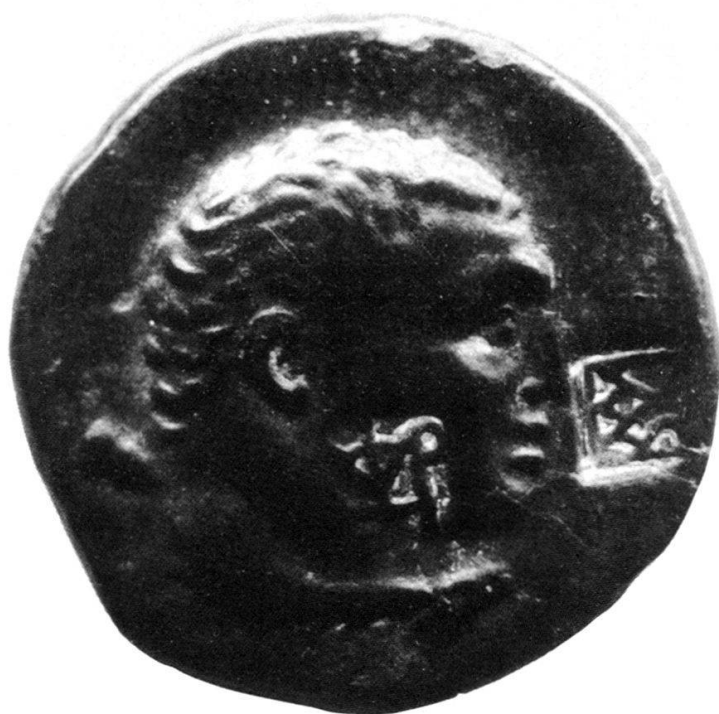
Fig. 4 Contremarques du bronze de Londres (× 3,5)

Dès lors, l'émission des bronzes royaux de Paphlagonie est le plus vraisemblablement antérieure à cette période, confirmant par là les résultats des appréciations stylistique et iconographique 21 .