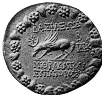
Fig. 3 Revers d'un tétradrachme de Mithridate Eupator 15

Il existe un second exemplaire de cette émission également contremarqué. Conservé au British Museum, il a été publié par Wroth en 1903 et se distingue par les deux contremarques apposées au droit 16 .