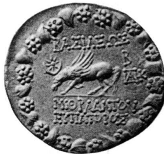
Fig. 3 Revers d'un tétradrachme de Mithridate Eupator 15

Il existe un second exemplaire de cette emission également contremarqué. Conservé au British Museum, il a été publié par Wroth en 1903 et se distingue par les deux contremarques apposées au droit 16 .