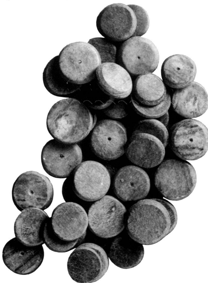
Fig. 1: Assortiment de jeu (jetons et dé).

Il contenait un matériel extrêmement intéressant constitué de 6 monnaies, d'un assortiment de jeu (40 jetons dont 2 portent en graffito le nom de leur propriétaire IUSTUS et 2 dés en os), d'une fibule, d'une petite boîte ronde (peut-être une boîte à cachet), d'une clé, de deux anneaux et d'un instrument métallique (peut-être une balance). 1