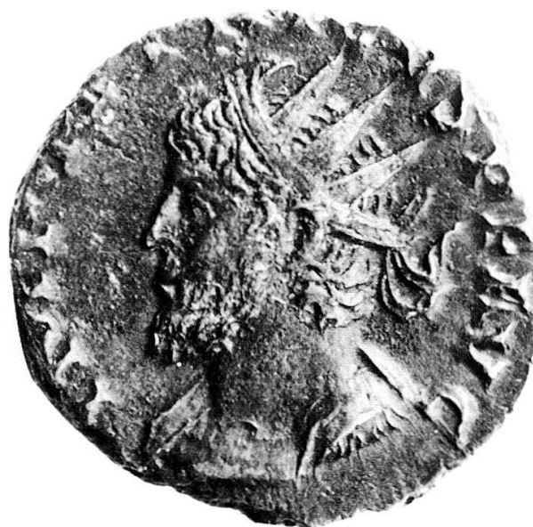
Fig. 2 (x 3)