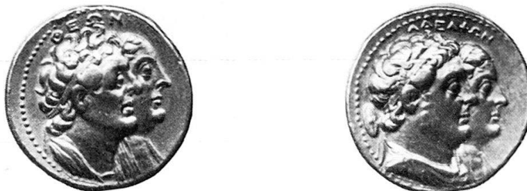
1 b Mnaeion (Gold-Oktadrachmon) des Ptolemaios II., Auktion Münzen und Medaillen AG 52 (1975), 238.

Nach Voegtlis Ansicht fehlen für diese Schildformen griechische oder makedonische Belege. Keltische Schilde haben zwar ovale Form, jedoch läßt sich daraus nicht der Schluß ableiten, daß alle ovalen Schilde keltisch sind, wie F. Meyer in einer Untersuchung über keltische Funde in Griechenland gezeigt hat 6 . Die näch-