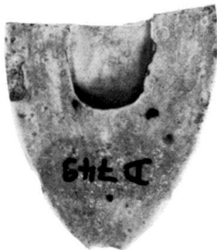
4 Fayence-Schild, Akademisches Kunstmuseum der Universität Bonn. Inv. D. 749.