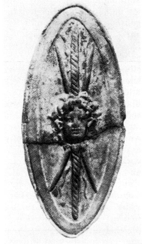
5 Terrakotta-Schild, Staatliche Museen zu Berlin. Inv. 33256.