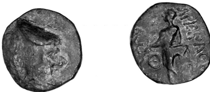
Fig. 1 Ariarathes III, bronzo inedito: collezione dell'autore. Ingr. 2 volte.

seduta, sia in piedi, effigie che rimarrà poi a caratterizzare tutta la monetazione di Cappadocia (con la sola eccezione dell'obolo e di un bronzo di Ariarathes VI) fino a che l'ultimo Re, Archelaus, la sostituirà con la clava di Ercole. Appare verosimile che questo bronzo (con un'effigie che non era mai comparsa prima, e che non comparirà mai più in seguito) abbia preceduto le monete con Athena, e costituisca quindi la prima monetazione di Ariarathes. Anche l'assenza del titolo di Basileus (a meno che le lettere illeggibili sul bordo s. della moneta non siano il residuo di questo titolo 2 , deporrebbe in favore dell'ipotesi che questa sia la prima moneta da lui coniata.