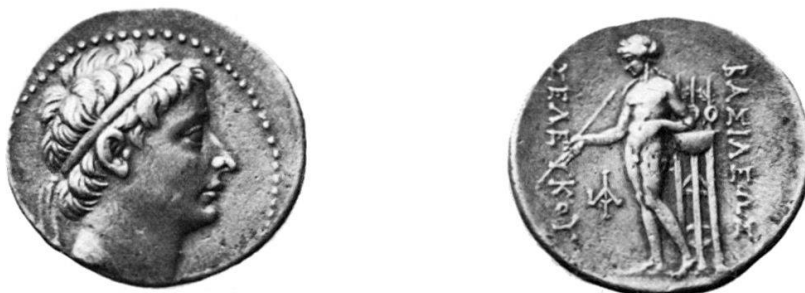
Fig. 2 Seleucus II Callinicus, Tetradramma, Antiochia: ex coll. Niggeler 457.

Una breve osservazione sul segno \odot che si trova nel campo del R/: J. N. Svoronos (Numismatique de la Péonie et de la Macédoine avant les guerres Médiques, Journal International d'Archéologie Numismatique, 1913, p. 193) ha mostrato come il segno \odot , non raro su monete traco-macedoni del IV secolo a. C., e generalmente interpretato come un \Theta e pertanto come l'iniziale di un magistrato, sia invece un simbolo, originario della Peonia, che sta a rappresentare il sole. Il nostro bronzo è stato coniato circa un secolo più tardi, ed è difficile scorgere un legame tra la Macedonia e la Cappadocia, sembrando troppo tenue quello rappresentato dal breve periodo (dal 322 al 301 a. C.) in cui questa fu governata da Satrapi Macedoni; ma è certo che anche in questo bronzo il segno \odot unito alla figura di Apollo suggerisce la probabilità che esso stia anche qui a rappresentare il simbolo del sole piuttosto che la lettera \Theta .