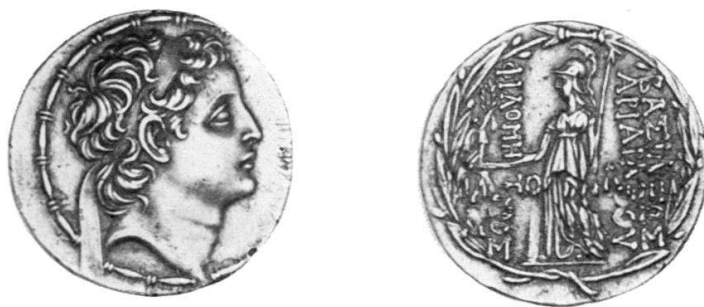
Fig. 3 Ariarathes VII, Tetradramma: Ex Vendita Leu 20 (1978), 154.

Anche qui è necessario rifarsi alla contemporanea monetazione Seleucide. In Siria, alla morte di Demetrius Nicator (125 a. C.), era salito sul trono il maggiore dei suoi figli, Seleucus V; ma la madre di lui, Cleopatra (che era stata successivamente moglie di Alexander Bala, di Demetrius Nicator e di Antiochus VII Sidetes) si affretta ad ucciderlo (o a farlo uccidere) per assumere lei stessa il potere. Ben presto però essa associa al trono il giovane Antiochus VIII Grypus (egli pure figlio di lei e di Demetrius), ma questi, nel 121 a. C., obbliga la madre a bere il veleno che essa stessa aveva preparato per lui, e rimane solo al potere (121–96 a. C.). Nel 114 a. C., però, si ribella contro di lui il fratellastro Antiochus IX Cyzicenus, figlio di Cleopatra e di Antiochus Sidetes (114–95 a. C.), ed il regno rimane diviso fra Antiochus VIII ed Antiochus IX, avendo quest'ultimo assunto il governo della Coele-Siria e della Phoenicia. Sia Antiochus Grypus (eccezionalmente), sia Antiochus Cyzicenus (quasi abitualmente) hanno coniato tetradrammi con l'effigie di Athena Nikephoros a s. e con la scritta ΒΑΣΙΛΕΩΣ ANTIOXOY ΕΠΙΦΑΝΟΥΣ il primo, e ΒΑΣΙΛΕΩΣ ANTIOXOY ΦΙΛΟΠΑΤΟΥΣ il secondo, e con monogrammi e lettere varie; il tutto entro una corona di due rami di lauro.