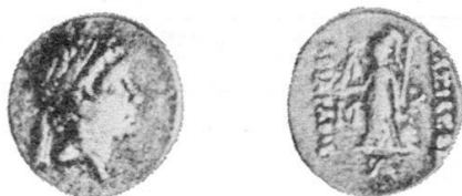
Fig. 6 Dramma di Ariarathes VI con diadema e con la semplice scritta ΒΑΣΙΛΕΩΣ ΑΡΙΑΡΑΘΟΥ (da Mørkholm, con l'attribuzione ad Ariarathes VIII).