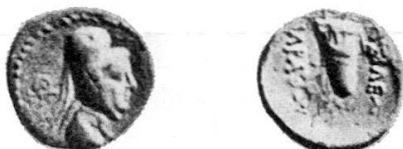
Fig. 5 Bronzo di Ariarathes VI (con tiara) (Coll. von Aulock, con l'attribuzione ad Ariarathes IV).