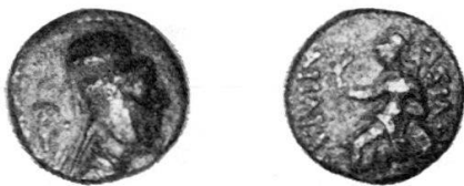
Fig. 4 Bronzo di Ariarathes VI (con tiara) (Coll. personale).