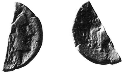
2 Nr. 10, Rhegion