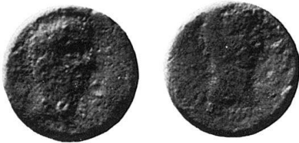
3 Nr. 15, Panormos