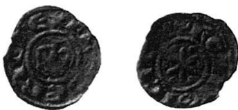
6 Nr. 21, Friedrich II.