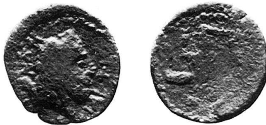
5 Nr. 17, Iaitas