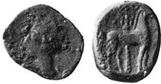
1 Nr. 1, Punisch