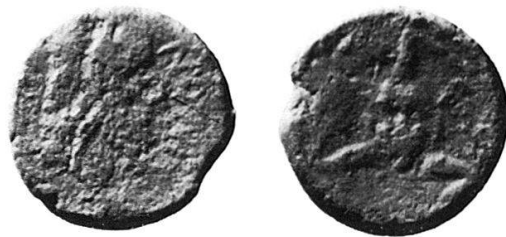
4 Nr. 16, Iaitas