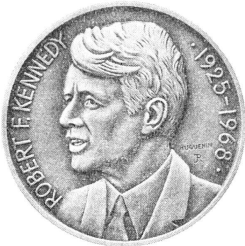
Huguenin Le Locle

Medaillen für Sammler Verlangen Sie unseren Katalog Médailles pour numismates Demandez notre catalogue