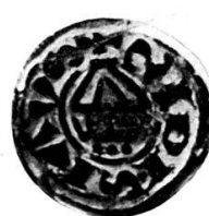
Moulage sans retouche