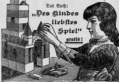
Das Buch: „Des Kindes liebtes Spiel“ gratis!

Von bleibendem Werte, eine dauernde Freude, anregend und bildend für die ganze Familie. In den bessern Spielwarenhandlungen.