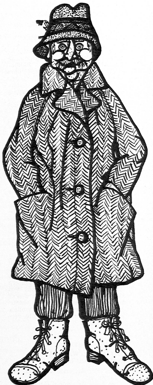
Illustration von Juditz Olonetzky aus SJW-Heft Nr. 1161 «Der Räuber Schnorzh»

Eine Geschichte von einem kleinen mexikanischen Indianerknaben als Lesestoff für unsere kleinsten Leser? Geht das denn? Ja, prachtvoll sogar. Die herzynig schöne Erzählung vom einfachen Leben einer armen Indianerfamilie ist so lebensnah, und dennoch echt poetisch dargebracht, dass der Verständniskontakt zwischen dem Leben unserer Kleinen und dem