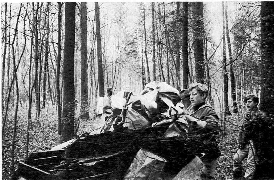
Fotografie aus SJW-Heft Nr. 1164 «Du und der Wald»