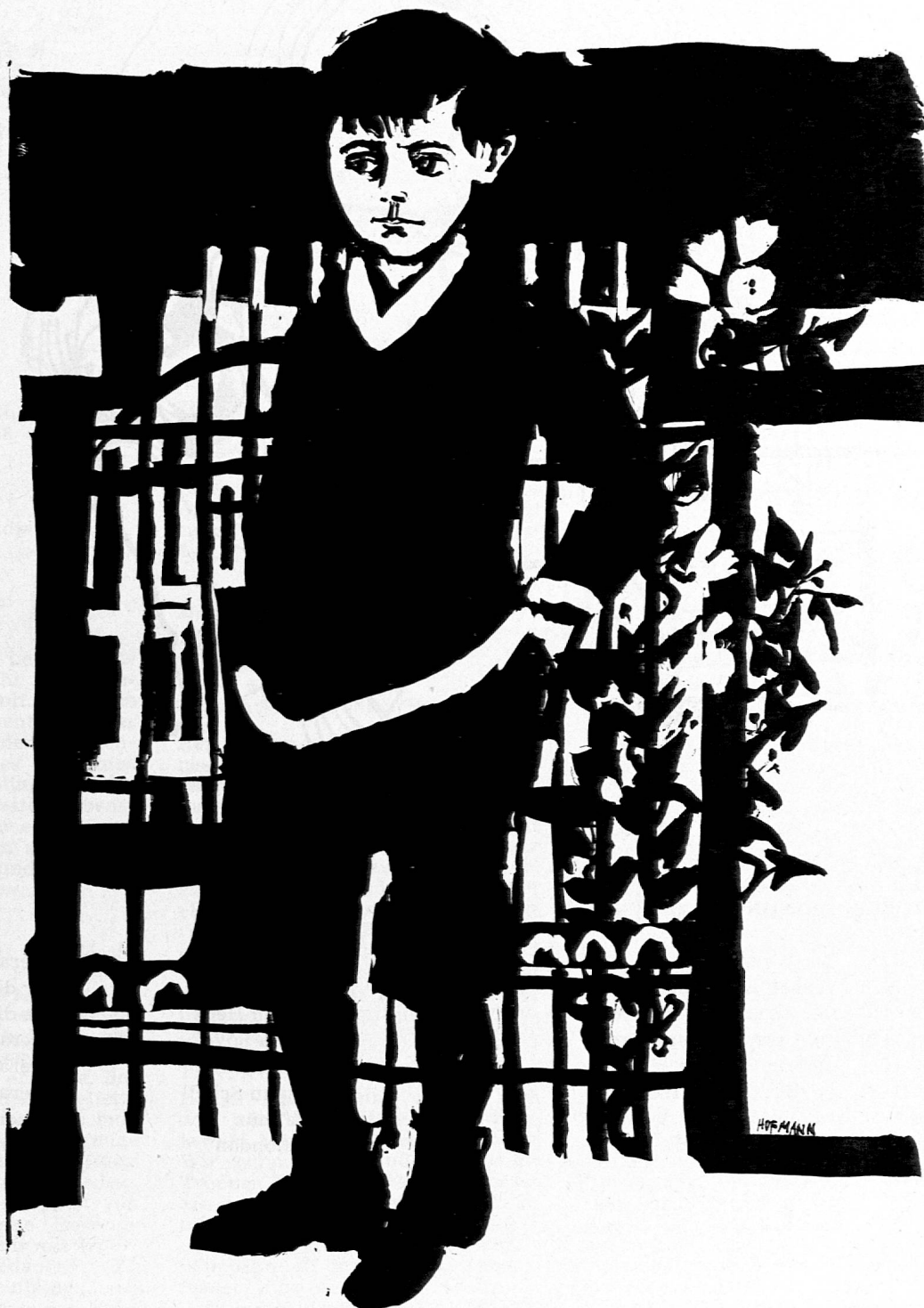
Illustration von Godi Hofmann aus SJW-Heft Nr. 1122 «Der vergessene Indianer»