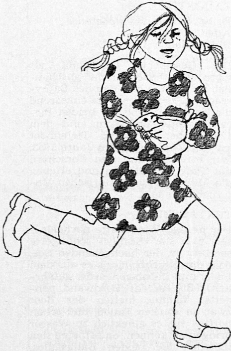
Illustration von Edith Schindler, aus SJW-Heft Nr. 1118 «Vreneli in der Stadt»

Reihe: Literarisches Alter: von 12 Jahren an Illustrationen: Irène Wydler