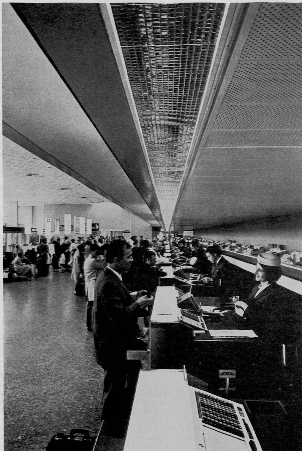
Aus SJW-Heft Nr. 1067 «Auf Besuch bei der Swissair» von Hansuli Hugentobler