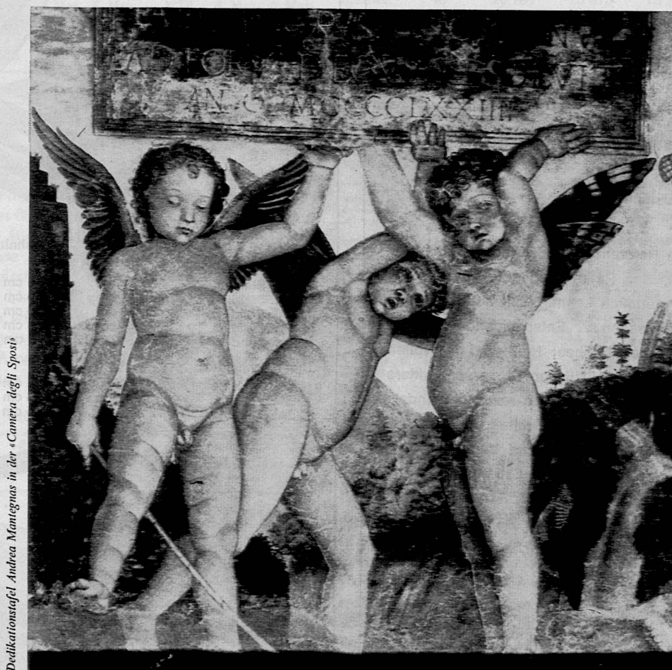
Dedikationstafel Andrea Mantegnas in der «Camera degli Sposi»

Kultur ist die Gesamtheit der Lebenserscheinungen und der Lebensäusserungen eines Volkes. – Kultur lässt sich nicht kaufen – aber sie lässt sich bilden und vertiefen, indem man sich regelmässig beschäftigt und auseinandersetzt mit allen ihren Erscheinungs- und Ausdrucksformen. «du», die schweizerische kulturelle Monatsschrift, informiert über die mannigfachsten kulturellen Bereiche. Mit einem «du»-Abonnement haben Sie den Finger am Puls des kulturellen Lebens.