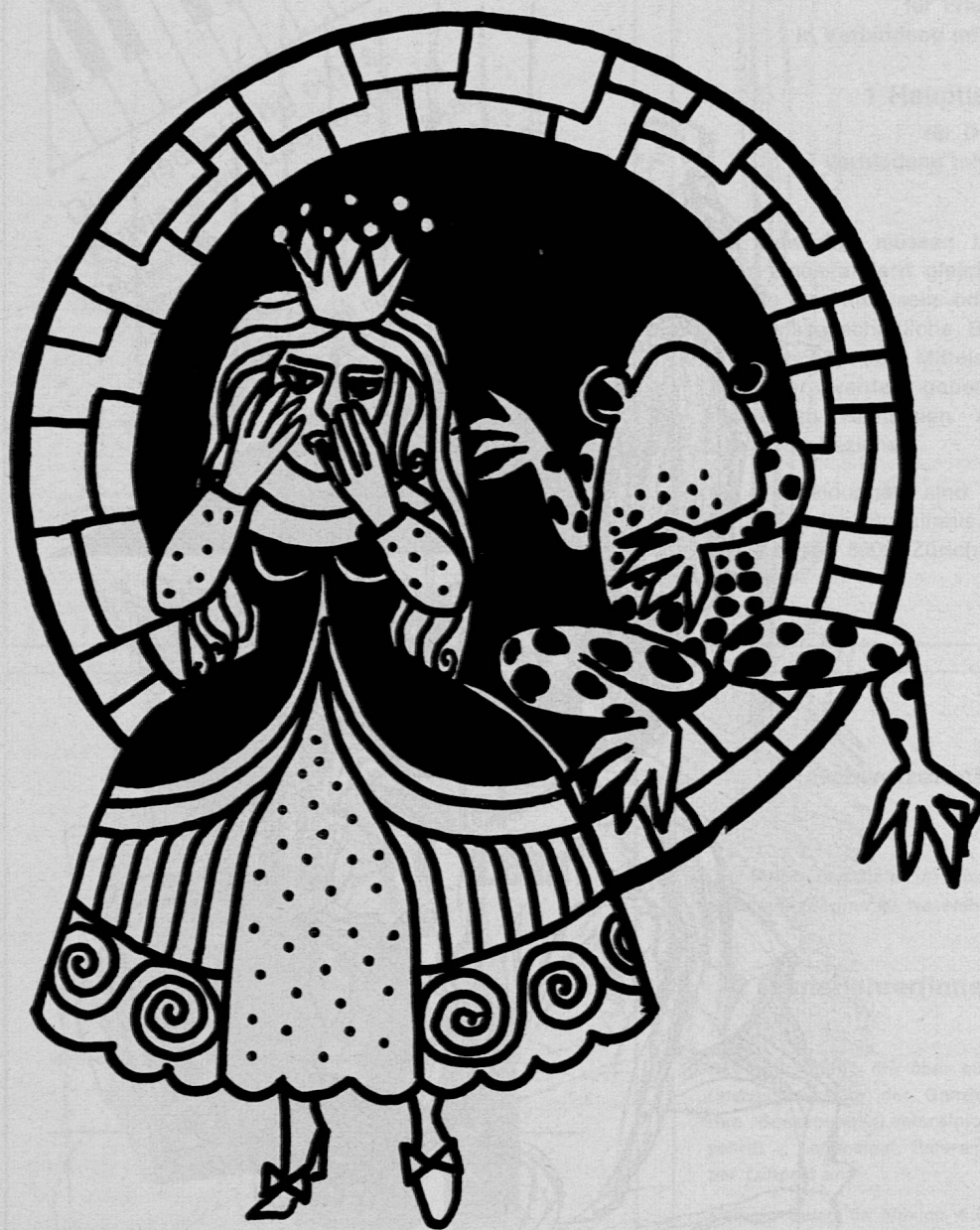
Illustration von Hildi Brunschwyl aus SJW-Heft Nr. 967 «Der Froschkönig»

Es sei noch darauf hingewiesen, dass das beliebte Heft Nr. 556 «Auf Burg Bärenfels» mit neuen Illustrationen erscheint.