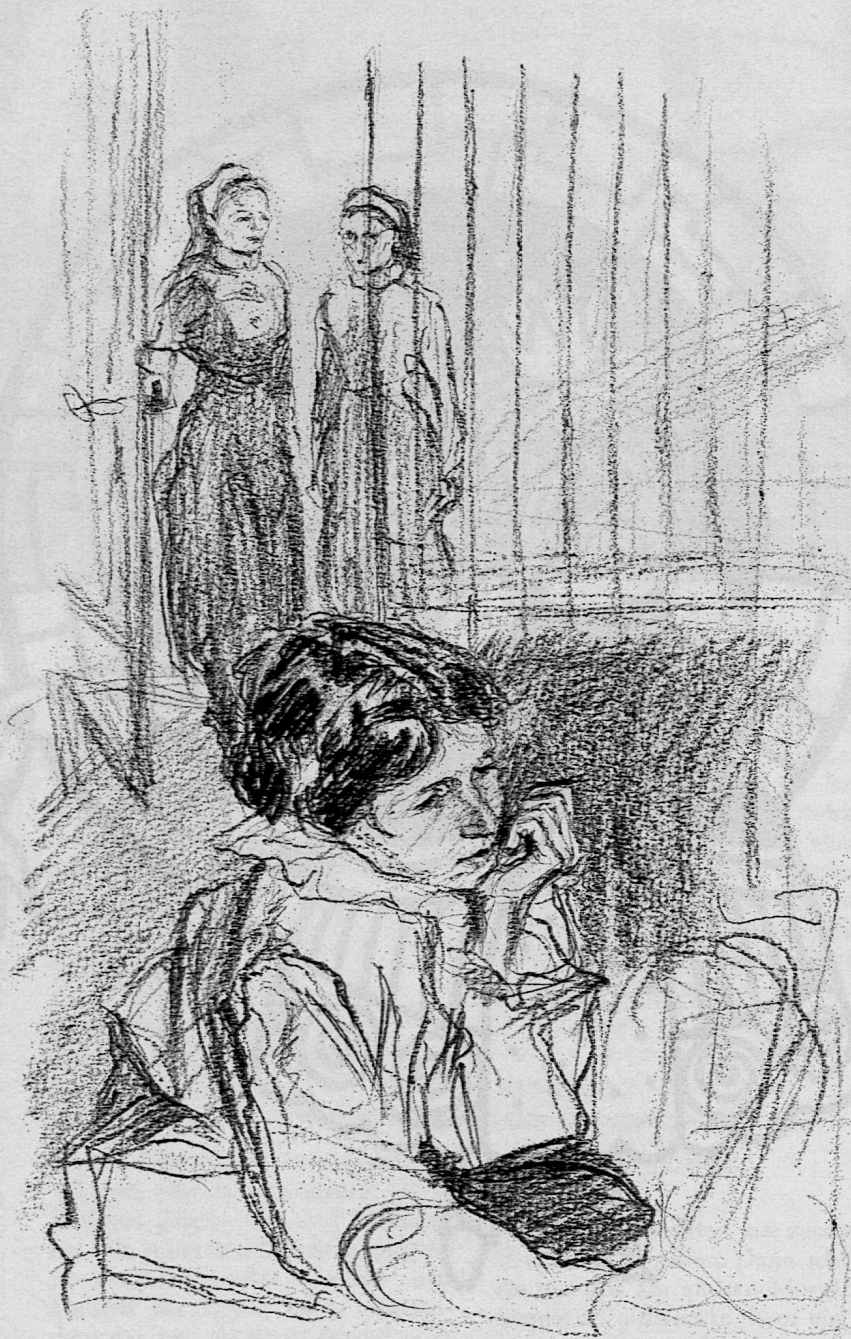
Illustration von Roland Thalmann aus SJW-Heft Nr. 966 «Melis Tierkrankenhaus»