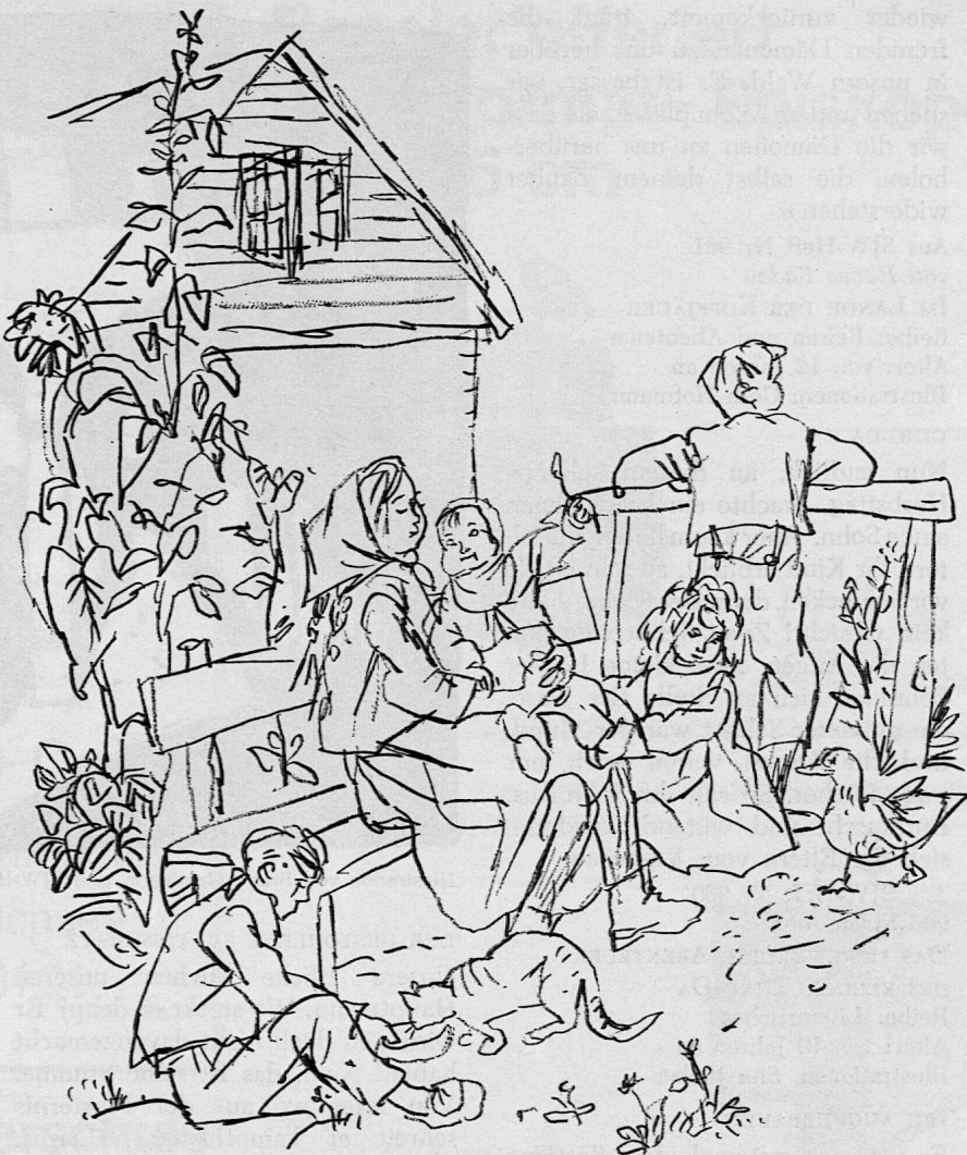
Illustration von Hanny Fries aus SJW-Heft Nr. 958 «Der Tausch»

In zwei sehr realistischen Erzählungen aus den Urwaldgebieten Südamerikas tritt der Tod in zweifacher Gestalt aus dem unheimlichen und unergründlichen Urwald hervor. In «Kopfjäger» ermordet ein alter Indio-Medizinmann einen Missionar, um ihn am Eindringen in sein Stammesgebiet zu verhindern. In «Tigrero» verliert ein erfahrener Tigerjäger im Kampf mit einer menschenfressenden Tigrin sein Leben. Beide Erzählungen