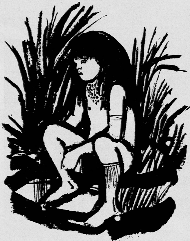
Illustration von Godi Hofmann aus SJW-Heft Nr. 961 «Im Lande der Kopfjäger»