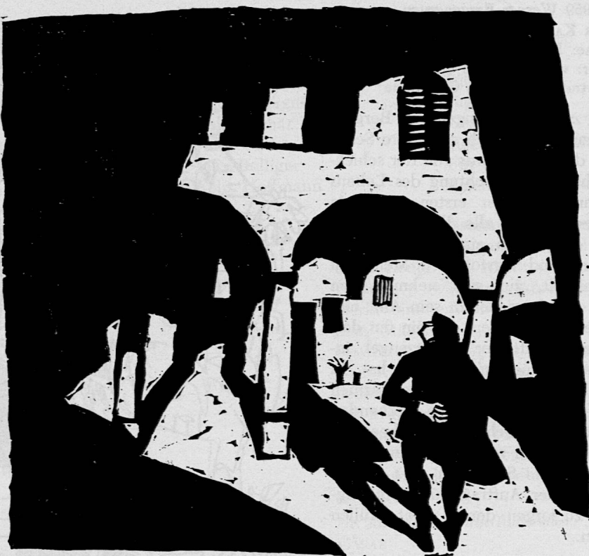
Illustration von Bruno Gentinetta zum SJW-Heft Nr. 959 «Der Kaiser im Elend»