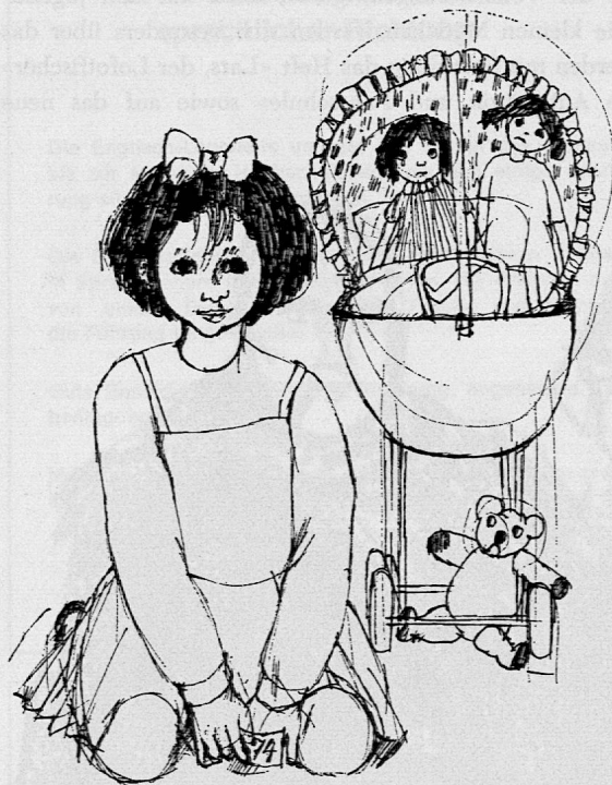
Illustration von Edith Schindler aus SJW-Heft Nr. 912 «Eveli und das Wickelkind»