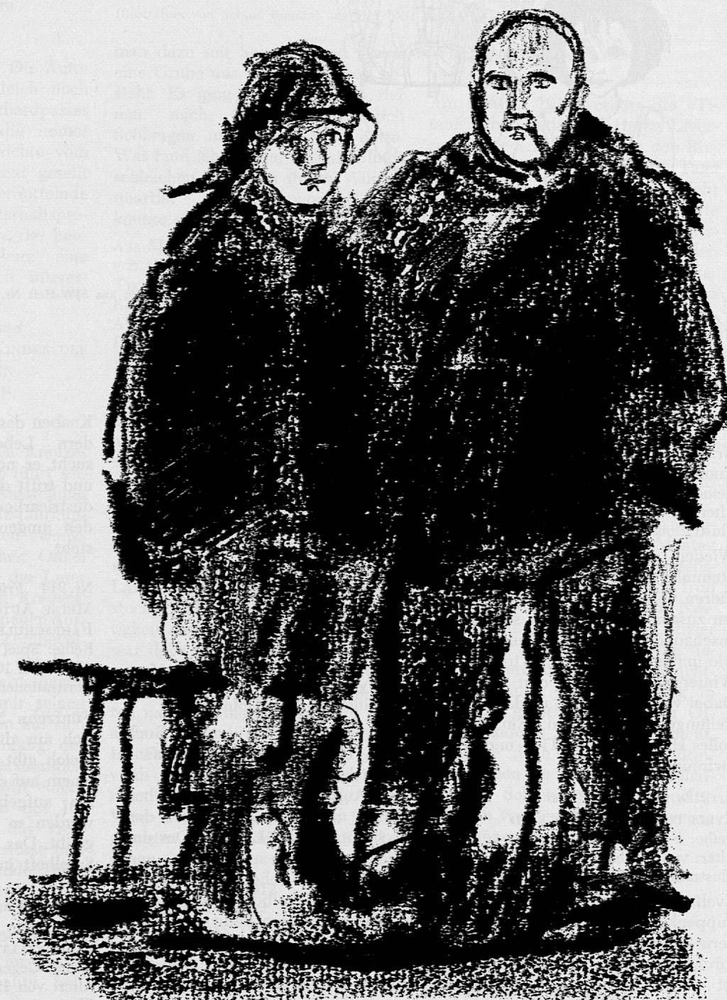
Illustration von Godi Hofmann aus SJW-Heft Nr. 913 «Lars, der Lofotfischer»

wird mit der Herausgabe von 7 Neuerscheinungen und 1 Nachdruck abgeschlossen. Die 48seitigen Hefte «Unsere Gotthardbahn» und «Wenn sich doch alle Kinder der Welt die Hand reichen...» (Die Geschichte des Roten Kreuzes) sowie das Heft «Gestohlen, verbrannt, verunfallt» (Entstehung und Aufgabe der Versicherungen) geben nicht nur den jugendlichen Lesern, sondern auch den Eltern aufschlussreiche Hinweise. Die kleinen Mädchen werden sich besonders über das Heft «Eveli und das Wickelkind» freuen; die grösseren Kinder aber werden mit Spannung das Heft «Lars, der Lofotfischer» lesen. Ganz besonders sei auch noch auf das Modellbogenheft «Meine Autofabrik und Fahrschule» sowie auf das neue Heft von Carl Stemmler «Tiere verschlafen den Winter» hingewiesen.