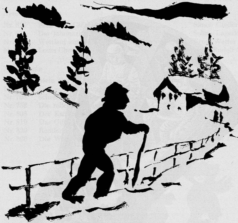
Illustration von Victor Surbek aus SJW-Heft Nr. 870 «Pech oder Glück»

lationen etwas zu tun. Für meinen Mann war es ein Spiel, das alles in Ordnung zu halten.»