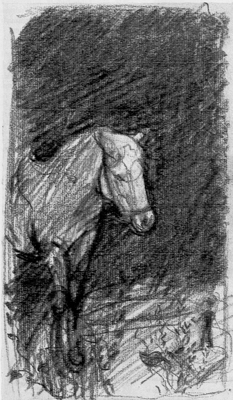
Illustration von Roland Thalmann aus SJW-Heft Nr. 871 «Der Jahrmarktsabend»