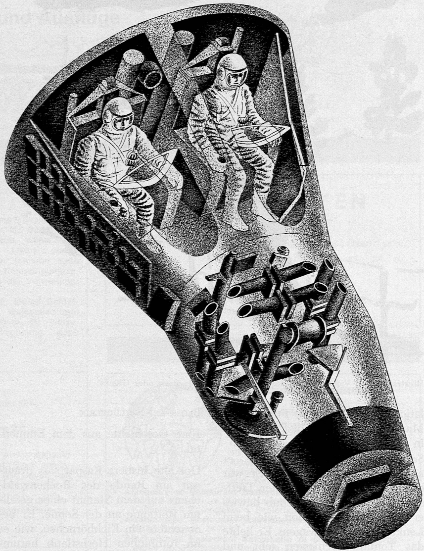
Illustration von Richard Gerbig aus SJW-Heft Nr. 872 «Wettlauf zum Mond»

Ganz ungewohnt für uns Menschen ist die Schwerelosigkeit, denn wir verspüren sie sehr selten. Auf der Erdoberfläche unterliegen wir der Beschleunigung der Erdanziehung, das heisst, wir stehen auf dem Fussboden mit dem Andruck von 1 g. Dieser Andruck kann sich ändern, beispielsweise wenn wir in einem