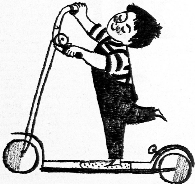
Illustration von Marianne Piatti aus SJW-Heft Nr. 847 «Tina»

Die nachstehenden Inhaltsangaben und Textauszüge geben einen Einblick in die neue Produktion des SJW.