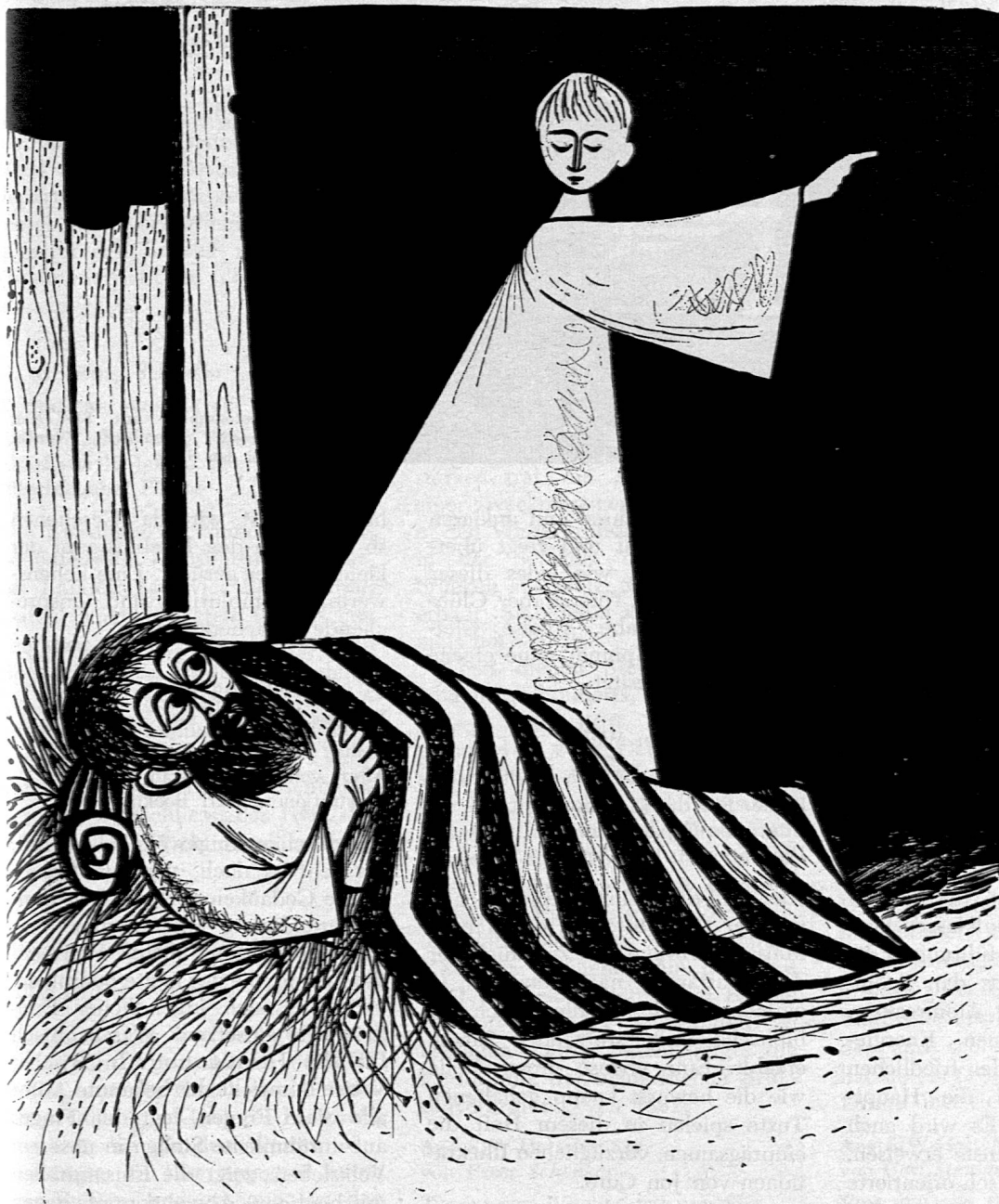
Illustration von Jon Curo Tramèr aus SJW-Heft Nr. 825 «Stille Nacht — Heilige Nacht»