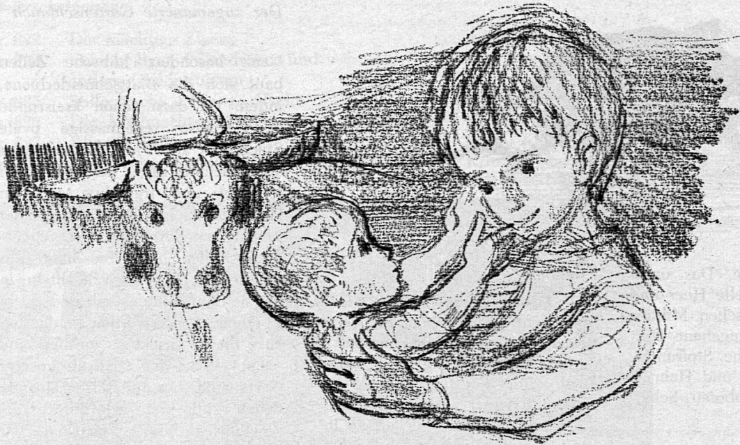
Illustration von Sita Jucker aus SJW-Heft Nr. 826 «Die Weihnachtsgeschichte»