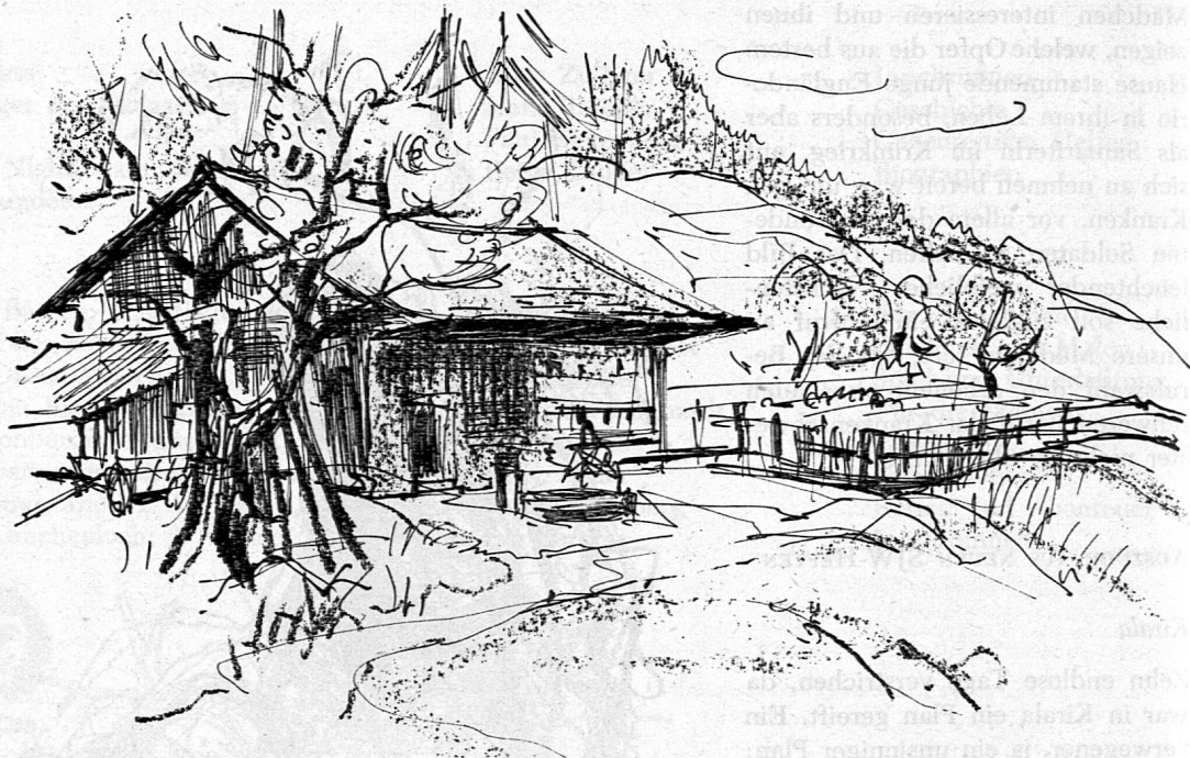
Illustration von Margarete Lipps aus SJW-Heft Nr. 819 «Das Giftfass»

gebratenen Rentierkeulen gütlich. Der Mann hält einen Lochstab in der Hand. Er ist also kein Fremder, er muss aus dem gleichen Volke wie unsere Jäger stammen; denn er kennt die geheime Kraft des Stabes, die bei den Rentierjägern der Gegend Ehrfurcht und Gehorsam erzwingt.