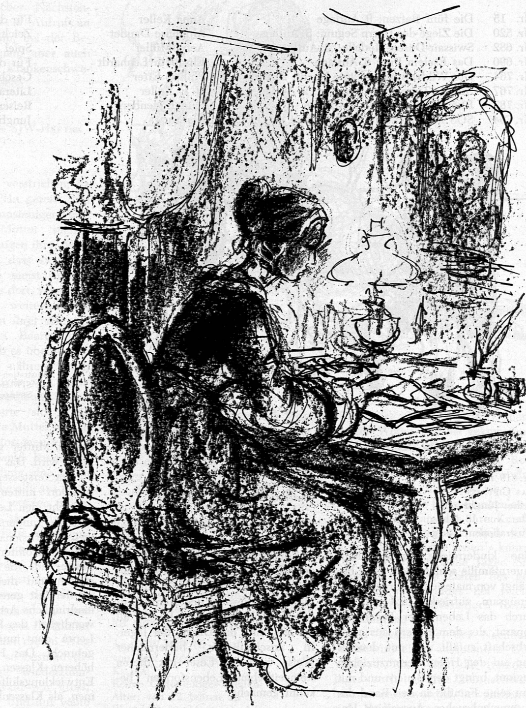
Illustration von Margarete Lipps aus SJW-Heft Nr. 824 «Florence Nightingale, der Engel der Verwundeten»