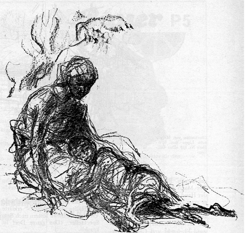
Illustration von Margarete Lipps aus SJW-Heft Nr. 821 «Kirala»

Aber plötzlich bleiben seine Augen an fellgekleideten Wesen haften, die zu Füßen eines überhängenden Felsens an einem Lagerfeuer sitzen. Es mögen zwei bis drei Dutzend sein, gross und klein, eine Jägerhorde wie die in der Höhle daheim.