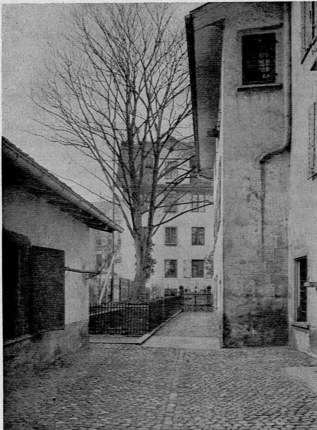
Das Haus «Zum Brunnen» der Familie Escher-Gossweiler, in dem Ebel jederzeit ein Zimmer zur Verfügung stand. — Blick von «In Gassen» nach dem Ahornbaum, der am 11. April 1911 gefällt wurde, weil er zu nahe der Neubaute der Schweizerischen Kreditanstalt (Griederhaus) stand. Aufnahme Hofer & Co., März 1911

den Dänen Friedrich Münter, dass er Stoff zu einem «Versuch über die Menschen und ihre Führung» sammle und darum eifrig lese 3 . In der Tat zeigen die «Bemerkungen zu gelesenen Büchern» (1788, 1792, 1793/94), dass Pestalozzi «eine neue Carriere» eingeschlagen hat, wie er an Münter schreibt. Hier interessiert besonders Pestalozzis Stellungnahme zu dem 1791 in Paris erschienenen Buche seines Landsmannes Jakob Heinrich Meister: «Des premiers principes du système social, appliqués à la révolution présente». Ebel stand mit Freunden in Paris in Verbindung, die ihn schon 1790 dahin hatten ziehen wollen. Was Pestalozzi von der Revolution dachte, musste ihn in hohem Masse interessieren. Man steht unter dem Eindruck, dass schon in Zürich Ebels späterer Aufenthalt in Paris vorbereitet wurde.