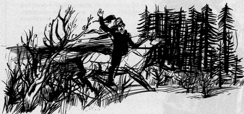
Illustration von Werner Andermatt aus SJW-Heft 784 «Freundschaft mit Habsburg»