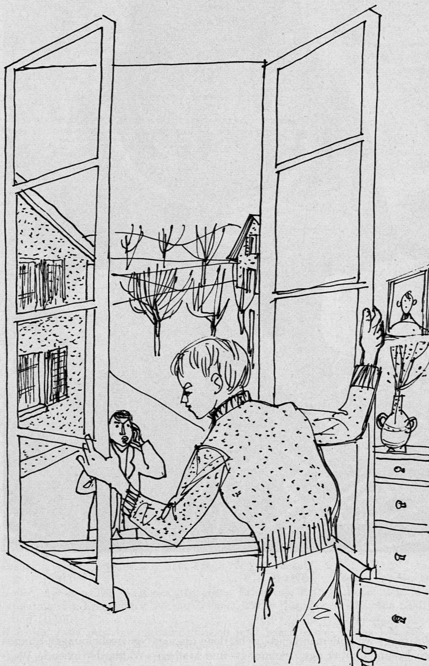
Illustration von Werner Christen aus SJW-Heft Nr. 735 «Der falsche Verdacht»

Geschichte Zeichnen und Malen Für die Kleinen Technik und Verkehr