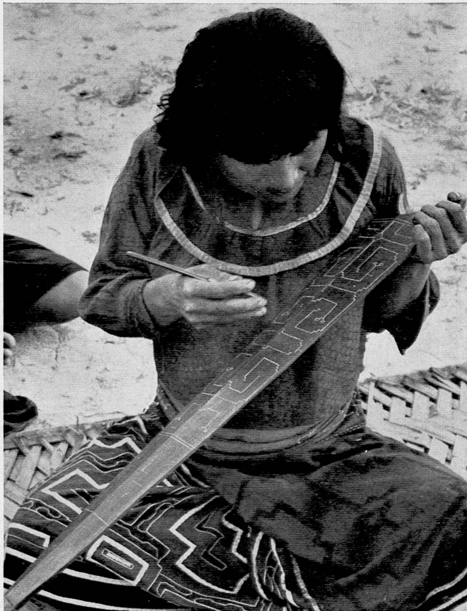
Photographie aus SJW-Heft Nr. 734 «Auf Indianerspuen» von Luise Linder und Heidi Egli