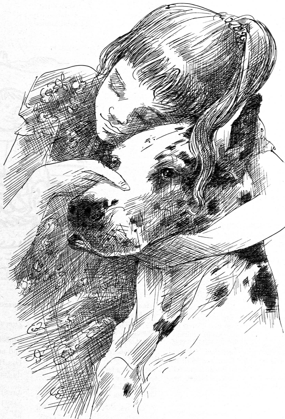
Illustration von Josef Keller aus SJW-Heft Nr. 709 «Tiergeschichten»

In den letzten Tagen hat das Schweizerische Jugendschriftenwerk wiederum vier Neuerscheinungen sowie vier Nachdrucke vergriffener, immer wieder verlangter Titel her-