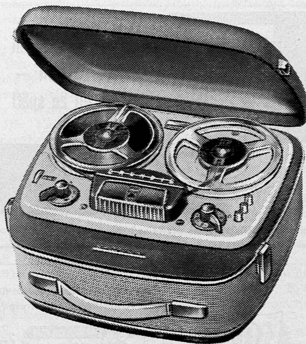
Typ. TK 20

GRUNDIG-Tonbandgeräte sind technische Spitzenleistungen, so vollkommen konstruiert, dass ihre Bedienung keine besonderen Kenntnisse erfordert. Sie erfüllen in der naturgetreuen Aufnahme und Wiedergabe höchste Ansprüche.